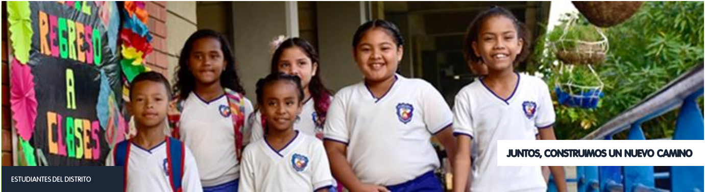
ESTUDIANTES DEL DISTRITO

Como funcionarios públicos, nos convertimos en garantes de los procesos que apuntan hacia el desarrollo y crecimiento de nuestra ciudad. Como miembros del equipo que trabaja por la educación de Barranquilla, tenemos en nuestras manos la responsabilidad del presente y futuro de nuestra sociedad: los niños y jóvenes. Su formación lo es todo, y lograr brindarla de la manera más efectiva, eficiente e integral, es el motor que nos debe alentar e impulsar, día a día para trabajar y realizar los esfuerzos necesarios por esta labor.