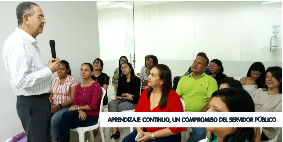
APRENDIZAJE CONTINUO, UN COMPROMISO DEL SERVIDOR PÚBLICO